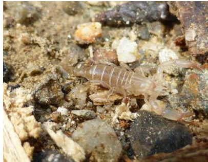
Belisarius xambeui jeune.