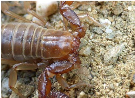
Belisarius xambeui .

par Ruben CENTELLES BASCUAS Groupe agenais de spéléologie (GAS47) 1