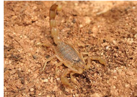
Buthus occitanus .